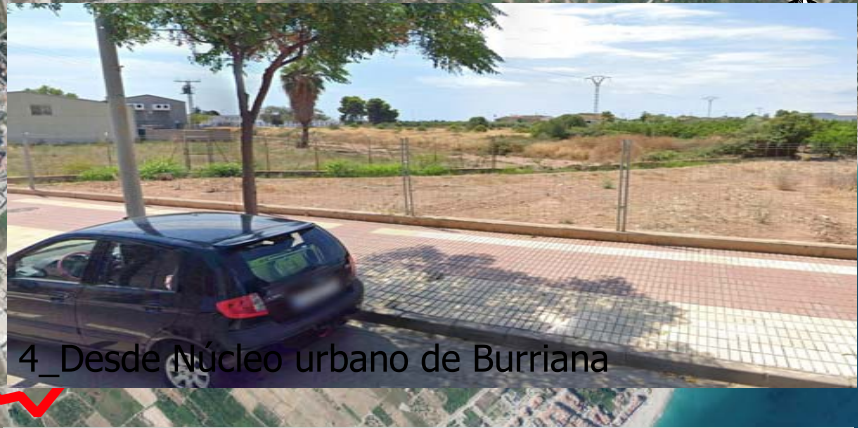
4_Desde Núcleo urbano de Burriana