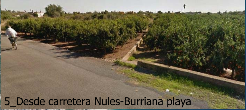
5_Desde carretera Nules-Burriana playa