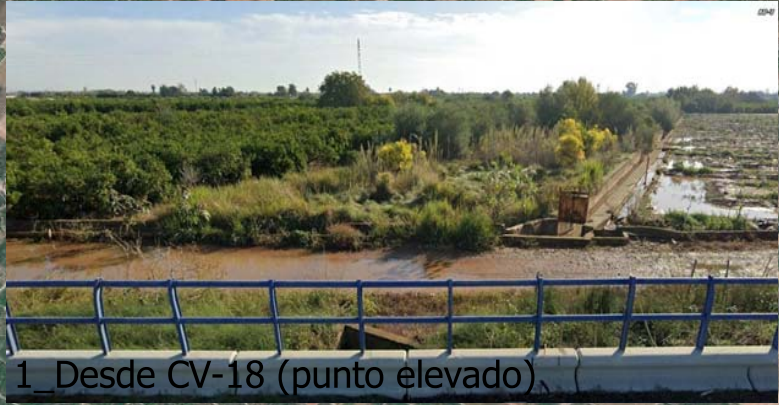
1_Desde CV-18 (punto elevado)