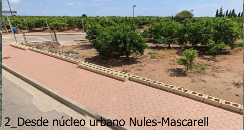
2_Desde núcleo urbano Nules-Mascarell