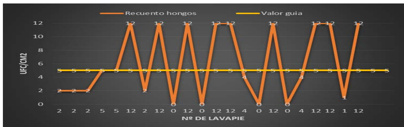
Tabla 1: Recuento de Hongos en cada Lavapie tomado en el mes JUNIO

Se establece como valor guía , según el método de análisis citado arriba, el valor de 5 ufc/cm 2 , de manera que a partir de este valor la superficie en concreto presenta riesgo sanitario. No obstante, este valor, podrá ser modificado en posteriores análisis, según la media estadística de los diferentes puntos.