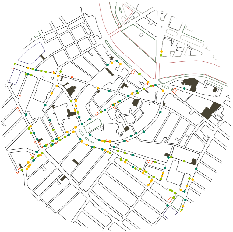
ANÁLISIS URBANO. ACTIVIDAD ECONÓMICA, SOLARES PRIVADOS Y PATIOS. E_1:7.500