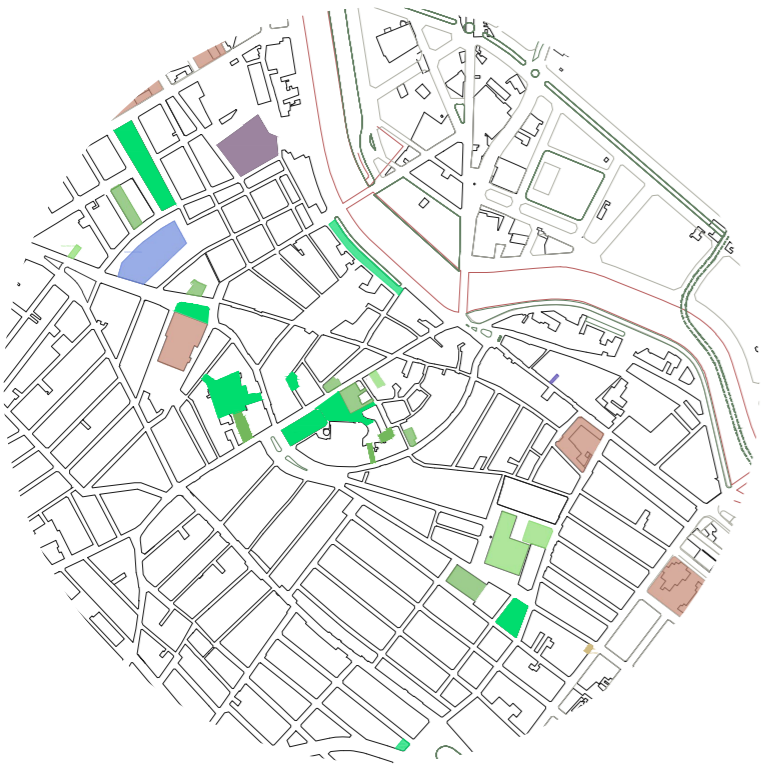
ANÁLISIS URBANO. ESPACIO PÚBLICO Y EQUIPAMENTOS. E_1:10.000