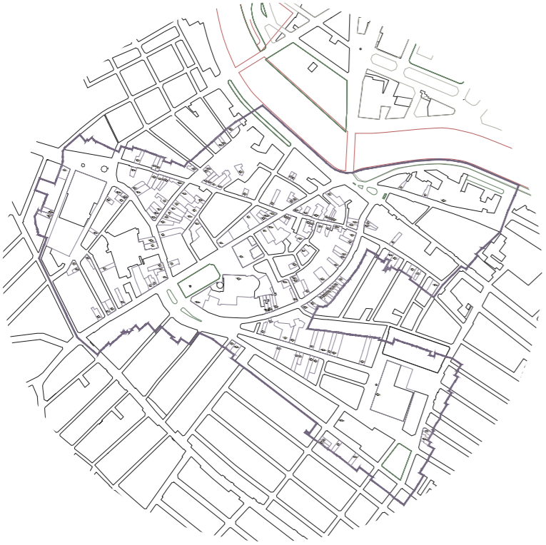
ANÁLISIS URBANO. PATRIMONIO CONSTRUÍDO. CATALOGO DE BIENES DE INTERÉS CULTURAL. E_1:7.500