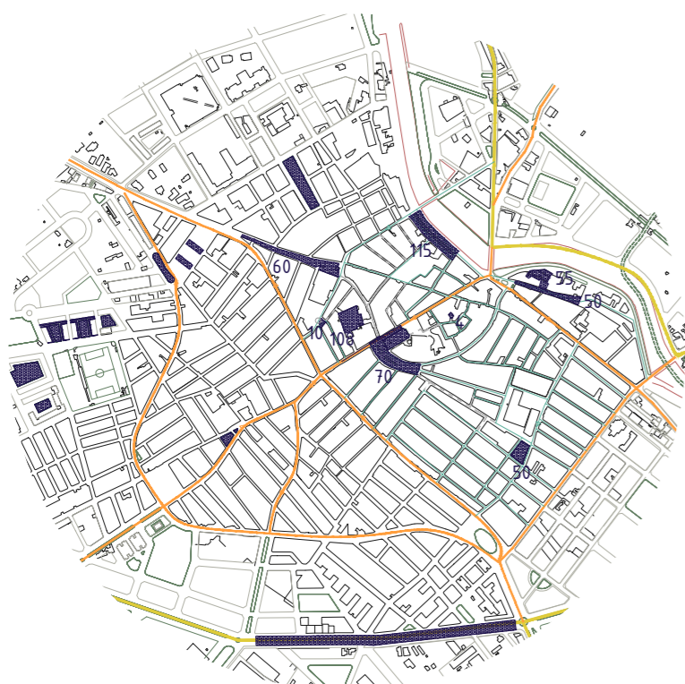
ANÁLISIS URBANO. MOVILIDAD. JERARQUÍA DE CALLES. E_1:15.000