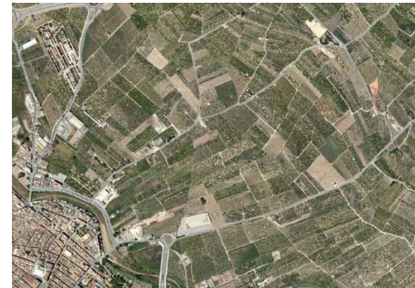
U.P. 4: Agrícola