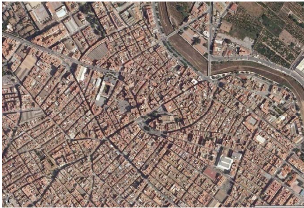
U.P. 1: Conjunto Histórico