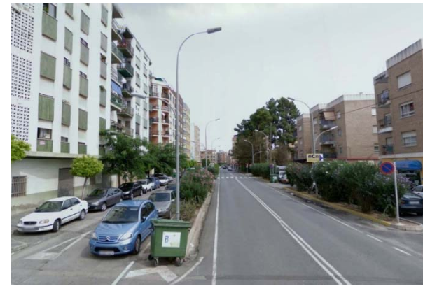
U.P. 2: Urbano