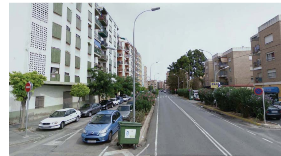
U.P. 2: Urbano / Urbà.