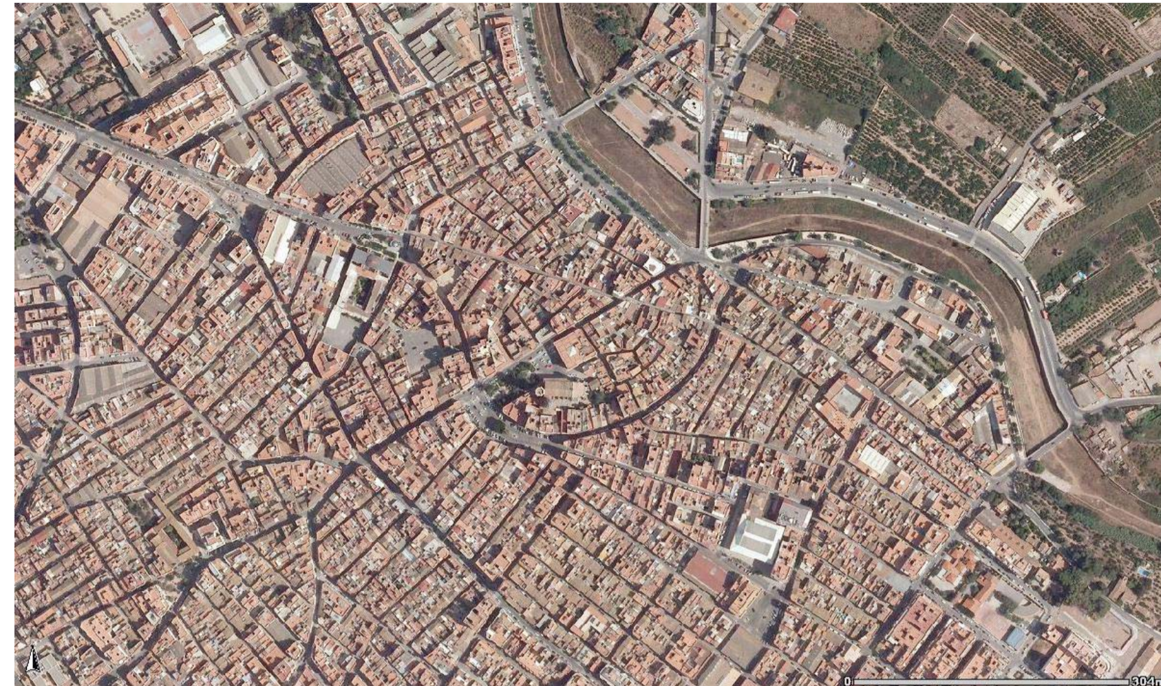
plano de situación / plànol de situació E: 1 / 20.000