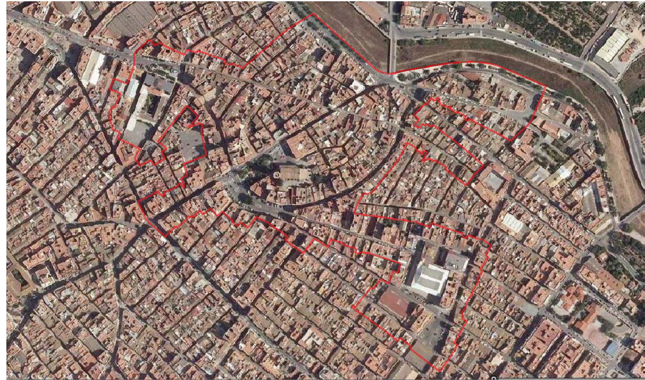
plano de unidades de paisaje / plànol d'unitats de paisatge