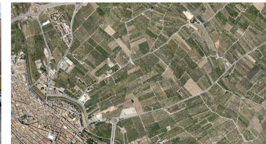
U.P. 4: Agrícola / Agrícola.