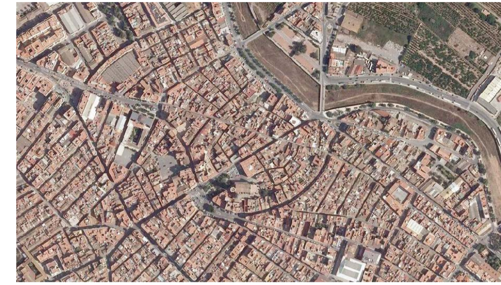
U.P. 1: Recinto Histórico / Recinte Històric.

S'entén per Unitat de Paisatge com l'àrea geogràfica, la configuració estructural, funcional o perceptiva de la qual, la fa única i singular, diferenciant-la del seu entorn pròxim. Posseix caràcters que la defineixen després d'un llarg període de temps. S'identifica per la seua coherència interna i les seues diferències respecte a les unitats contigües.