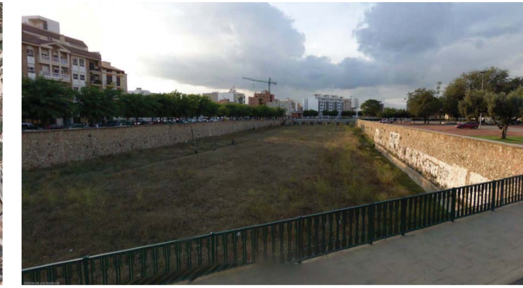
U.P. 3: Fluvial / Fluvial.