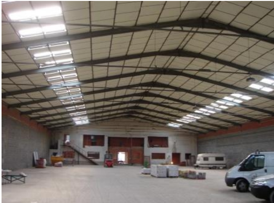
INTERIOR DE UNA DE LAS NAVES