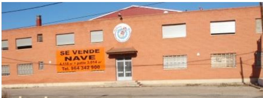
FACHADA DE UNA DE LAS NAVES