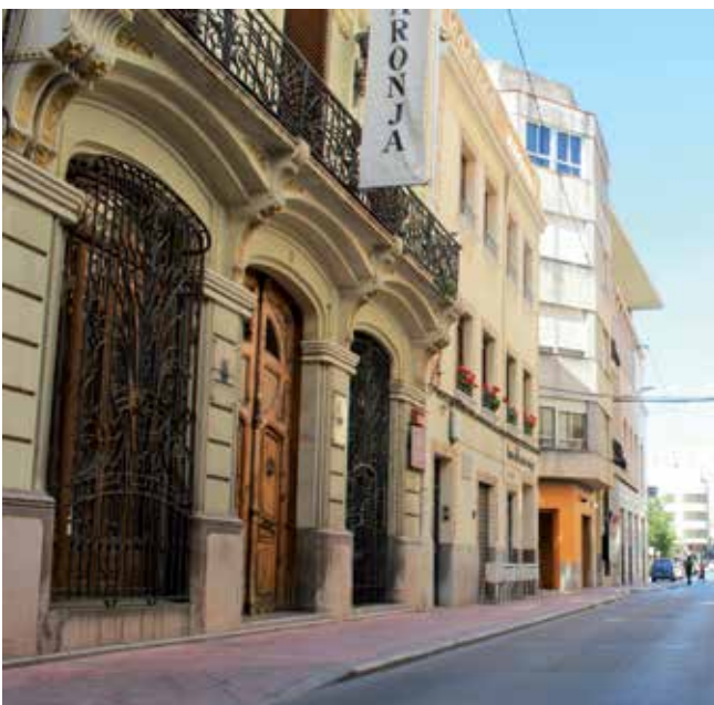
Museu de la Taronja / Escola de la Mar