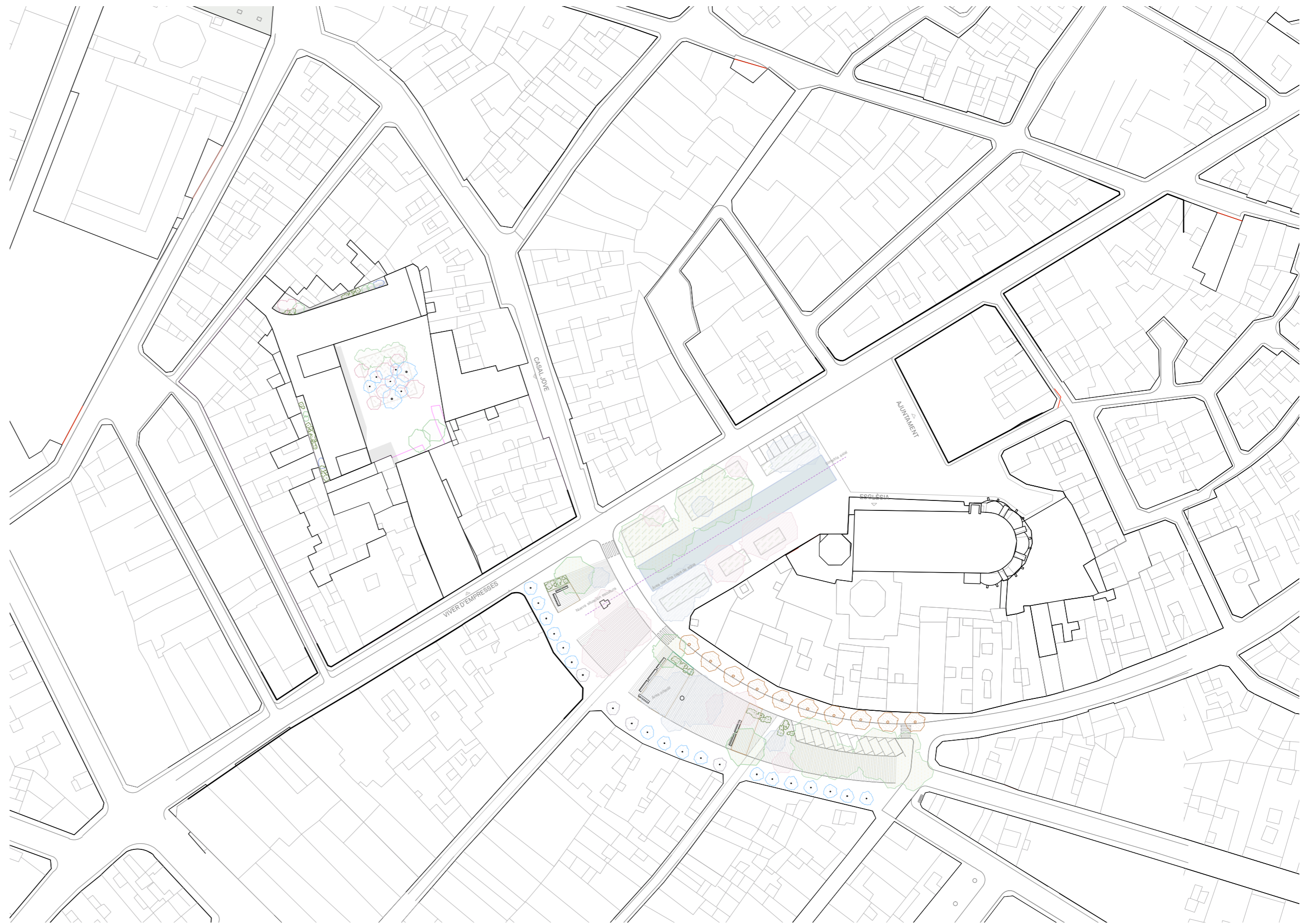
Plano de ordenación general E 1.1000