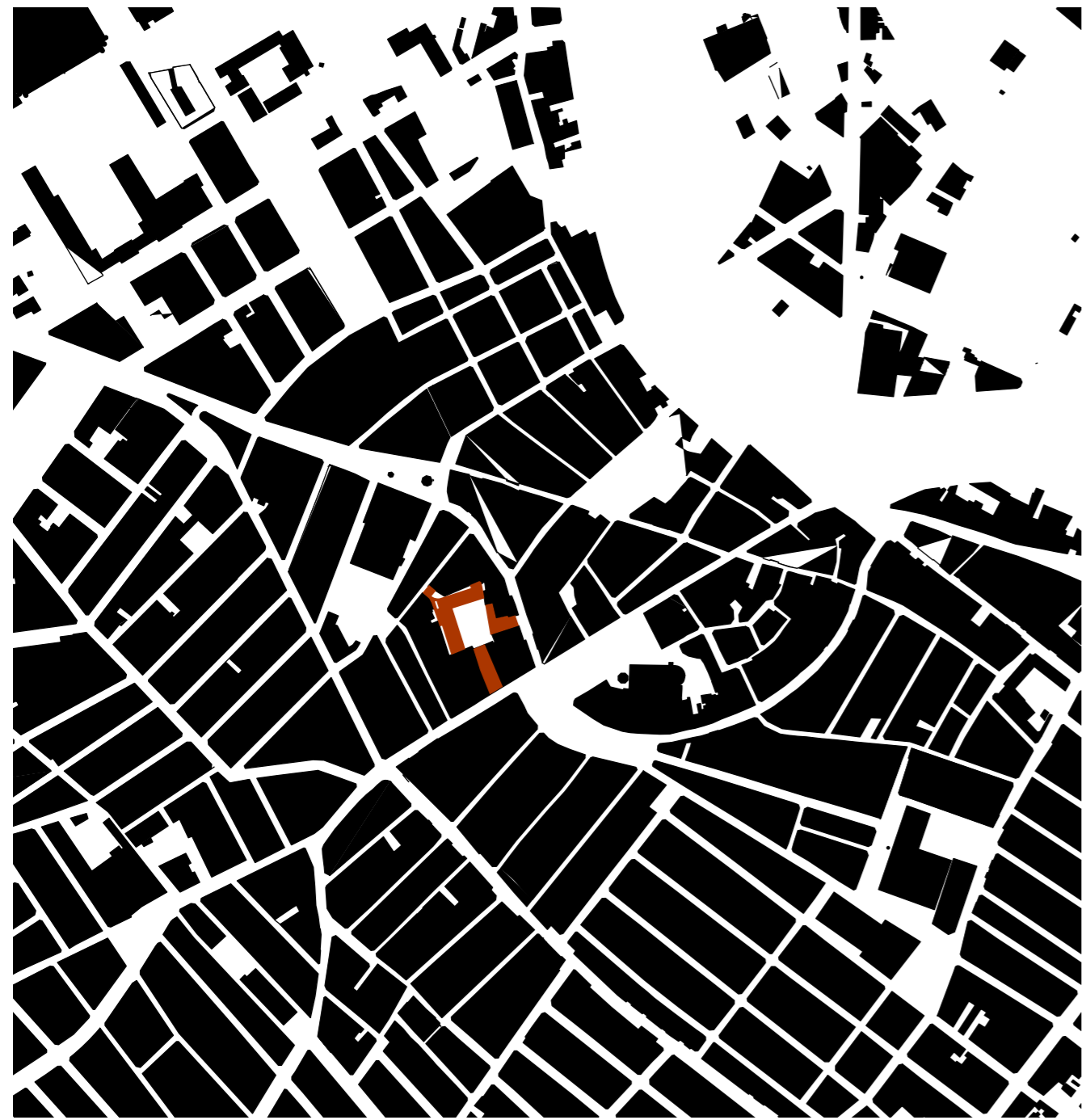
Encaje urbanístico E 1/5.000