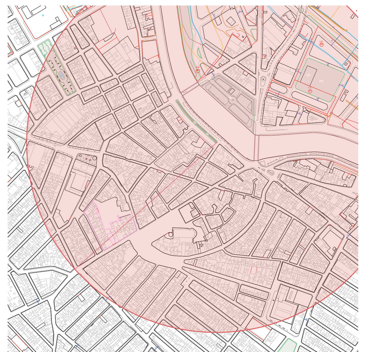
Situación del nuevo Aparcamiento y un radio de 400m (5 minutos andando)