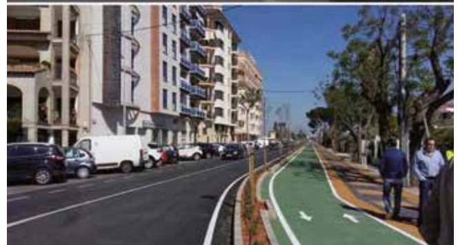
Carril ciclovianants Borriana-Port